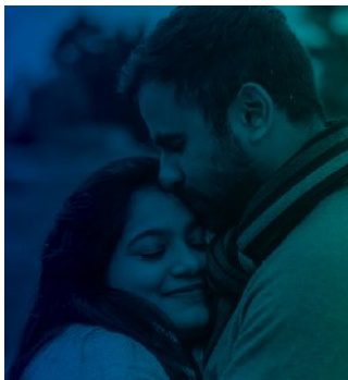
ПОКА У ВАС НЕТ ДЕТЕЙ