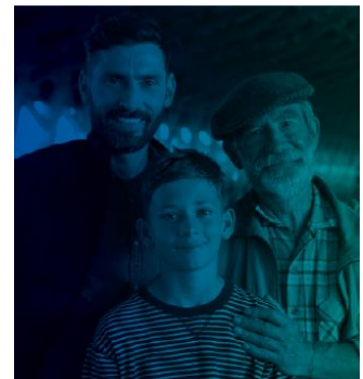
КОГДА ВАШИ ДЕТИ СТАНУТ СТАРШЕ