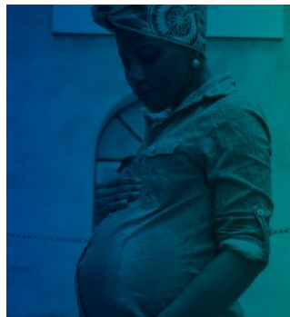
В ТЕЧЕНИЕ БЕРЕМЕННОСТИ