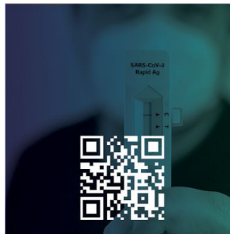
Solicite pruebas de detección